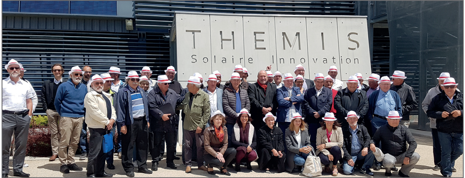
Comité Syndical du 30 juin - Centrale Solaire de Thémis (voir p.3)