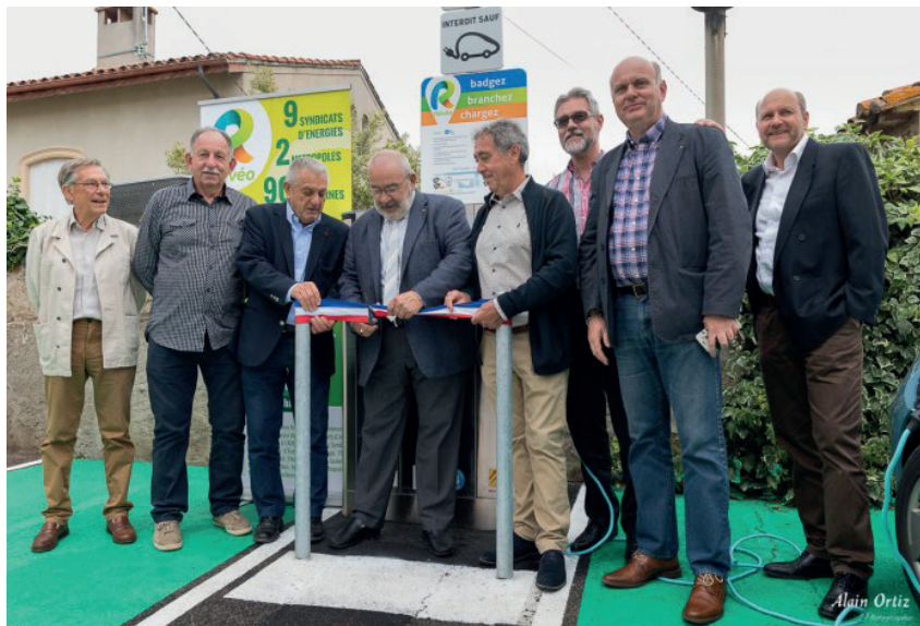
Inauguration Vinça, 3B rue des Jardins de la mairie

Le SYDEEL66, maître d'œuvre et d'ouvrage, se réjouit de participer avec ce déploiement de bornes de recharge, au développement de l'électromobilité mais aussi à la protection de l'environnement. De plus, se munir d'une borne permet aux communes d'obtenir un atout supplémentaire pour le tourisme local et départemental. Ce réseau permet ainsi de proposer aux administrés un ensemble de bornes présentes sur le domaine public et accessibles à tous.