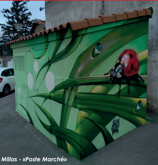
Millas - «Poste Marché»